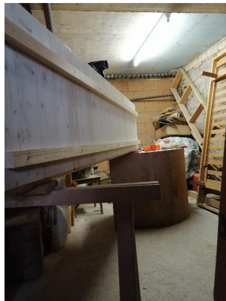
Abbildung 21 Leisten an Tür als Verstärkung (Jan,2020)

Als Verstärkung für die Tür ging ich nochmals zu Zbären Kreativküchen AG, um leisten zu holen, weil wir zu Hause keine mehr hatten.