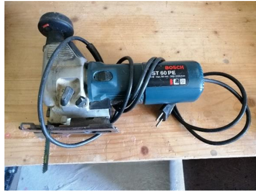
Abbildung 30 Stichsäge (Jan,2020)

Brauchten wir, um die Leisten zuzusägen.