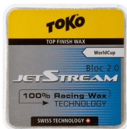
Abbildung 4 Jet Stream Bloc 2.0 (www.google.com,2020)

Als letzte Variante gibt es noch der Helix. Der Helix kann man ganz einfach auf den Belag aufsprühen und dann trocknen lassen.