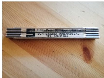
Abbildung 32 Meter (Jan,2020)

Um die Leisten richtig auszumessen und das andere Holz auch.