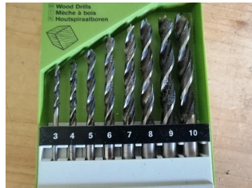
Abbildung 31 Bohrer (Jan,2020)