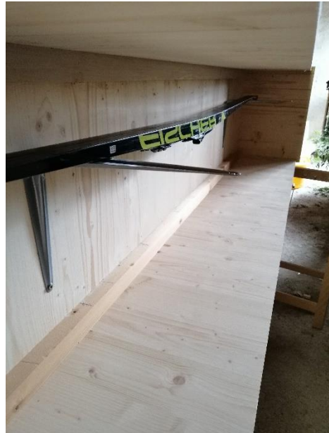
Abbildung 16 Konsolen mit Ski darauf (Jan,2020)

Dann kamen die Konsolen angeschraubt, dort wo danach die Skis darauf kommen.