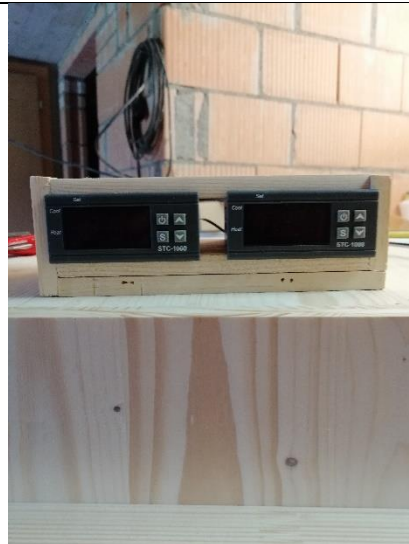
Abbildung 23 Thermostat im Kasten (Jan,2020)

Dann kam die Elektronik daran. Zuerst baute ich einen Kasten, damit wir den Thermostat an die Box schrauben konnten.