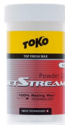
Abbildung 6 Jet Stream Powder 2.0

Eine Möglichkeit ist mit Heisswachs, von dem es 3 verschiedene Varianten gibt: einmal ohne Fluor, einmal mit wenig Fluor und mit sehr viel Fluor. Als Rennfinish gibt es Pulver, das gleichmässig auf den Ski verteilt und dann mit dem Bügeleisen eingebügelt wird. Dann als schnellere Variante zum Präparieren das Jet Stream. Das ist ein kleiner Block, den man auf den Ski aufreiben kann und danach mit einem Kork in den Belag kochen muss.