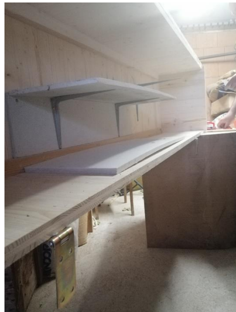
Abbildung 19 Fermacellplatten (Jan,2020)

Dann kam noch die letzte Fermacellplatte in die Box und zwar auf den Boden, wo dann die Heizung daraufgestellt wird.