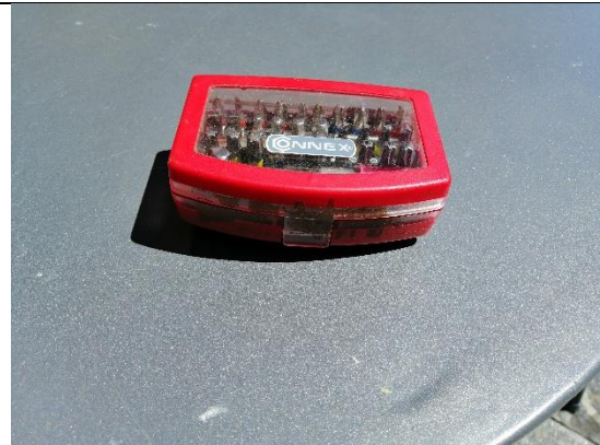
Abbildung 36 Torx (Jan,2020)