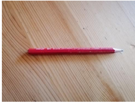
Abbildung 33 Bleistift (Jan,2020)

Um auf dem Holz Linien zu zeichnen und dann genau sägen zu können.