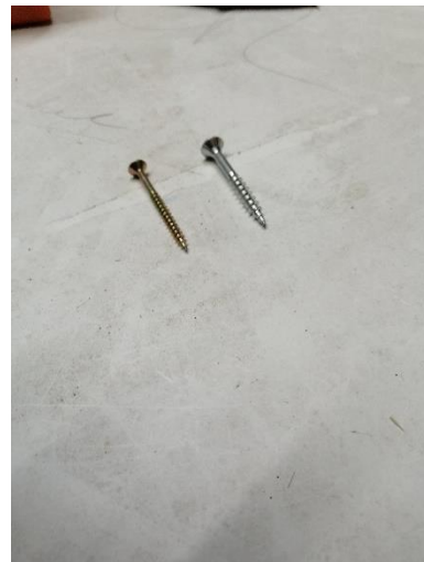
Abbildung 37 Schrauben (Jan,2020)