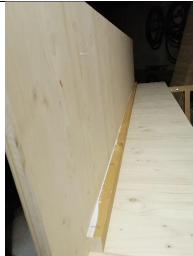
Abbildung 11 Boden mit Seitenwand (Jan,2020)

Dann haben wir die Seitensand und dann den Boden geschraubt.