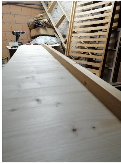
Abbildung 10 Boden mit Leiste (Jan,2020)

Zuerst haben wir die erste Leiste an den Boden geschraubt, damit der Boden stabiler ist.