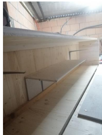
Abbildung 17 Fermacellplatten (Jan,2020)

Dann kamen die etwas kleineren Konsolen angeschraubt, so dass man die Fermacellplatten darauflegen kann.