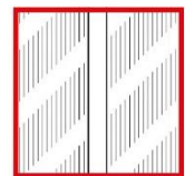
Abbildung 8 Struktur Gerät Rot (www.toko.ch,2020)

ähnliche Art wie bei Toko der Helix ist. Wenn der Schnee extrem nass ist, gibt es noch ein Strukturgerät, damit man in den Belag eine Struktur hineinpressen kann, damit das