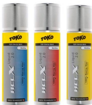
Abbildung 5 Helix 2.0 (www.google.com,2020)

Fluor ist im Langlauf ein sehr wichtiges Produkt für die Servicemänner. Fluor hilft, dass die Skier bei sehr warmen Temperaturen, wenn viel Wasser im Schnee ist, besser über den Schnee gleiten. Fluor kann in verschiedenen Formen auf die Skier gewachst werden.