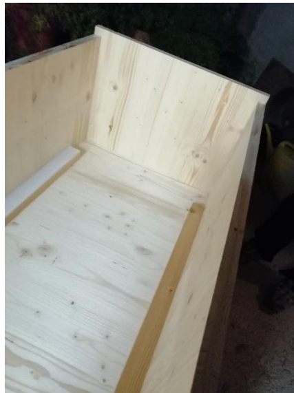
Abbildung 13 Seitenwand mit Boden, Deckel und Stirnseite (Jan,2020)

Danach kam die Stirnseite daran. Dort mussten wir schauen, dass es genau angeschraubt wird.