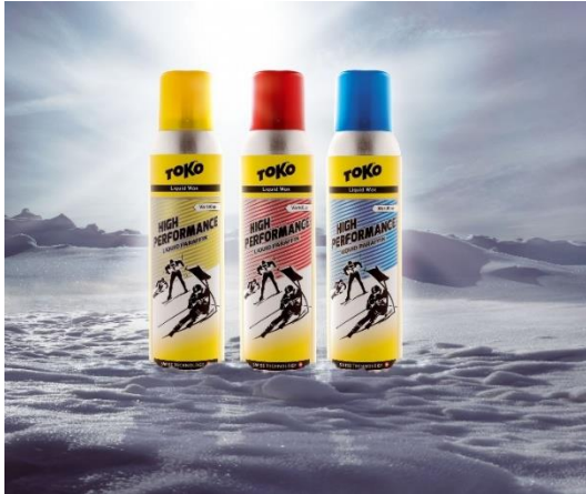
Abbildung 2 Toko High Performance Liquid Paraffin ( www.google.com ,2020)