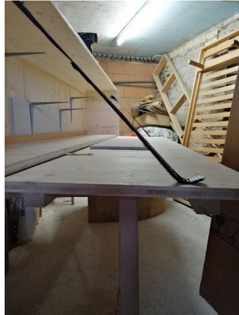
Abbildung 20 Tür mit Band fixiert (Jan,2020)

Dann schraubten wir die Tür fest an die Scharniere. Dort mussten wir noch am Boden ein wenig Holz wegnehmen, dass man die Tür gut schliessen kann. Als Verstärkung, dass die Türe nicht so durchhängt, schraubten wir alte Skischuhbänder an.