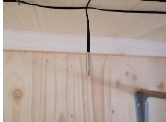
Abbildung 27 Wärmefühler (Jan,2020)

Dann mussten wir noch die Fühler vom Thermostat in die Box hängen, damit man die Temperatur messen kann.