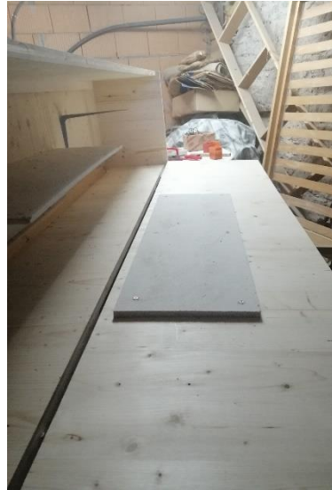
Abbildung 18 Fermacellplatten (Jan,2020)

Dann schraubten wir die zweite Fermacellplatte an die aufklappbare Tür, damit das Holz nicht zu heiss wird.