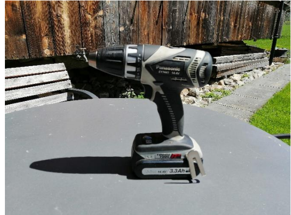
Abbildung 35 Bohrmaschine (Jan,2020)

Brauchte sie, um die Schrauben rein zu schrauben.