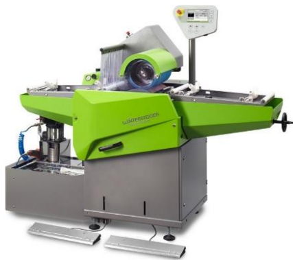
Abbildung 3 Schleifmaschine