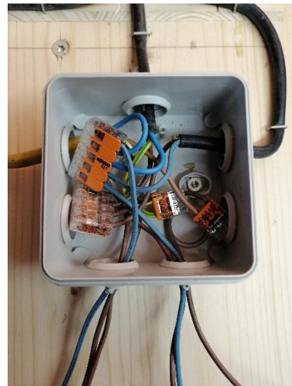
Abbildung 25 Dose mit Kabel (Jan,2020)

Dann mussten wir alles mit Klemmen verbinden, damit wir die Heizung an den Thermostat anschliessen konnten.