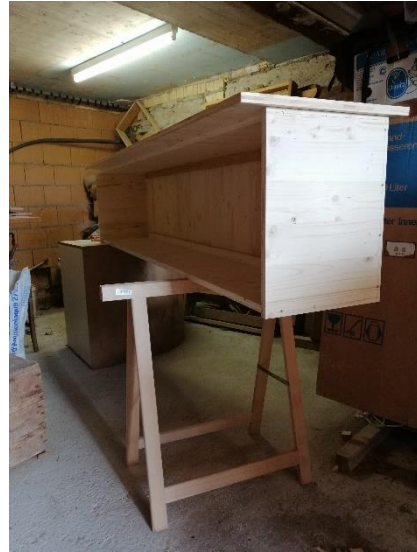
Abbildung 14 Seitenwand mit Deckel, Boden und beide Stirnseiten (Jan,2020)

Dann kam die andere Stirnseite angeschraubt. Wie die vorher.