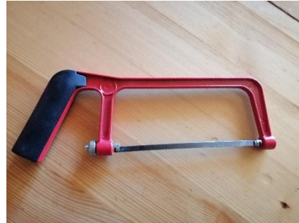
Abbildung 34 Kleine Säge (Jan,2020)

Ich brauchte sie, um den Kasten für den Thermostat zuzusägen.