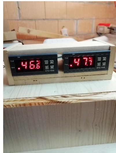
Abbildung 28 Thermostat Funktionieren (Jan,2020)

Als wir alles angehängt hatten, stellten wir den Thermostat ein und schauten, ob alles funktioniert.