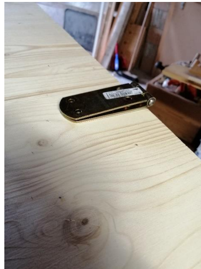
Abbildung 15 Scharnier (Jan,2020)

Dann kam die zweite Seitenwand daran, die zugleich die Türe ist, um die Box aufzumachen. Dort mussten wir mit Scharnieren arbeiten. Wir schraubten sie an und mussten schauen, dass sie genug weit vorne ist, so dass wir die Box gut auf- und zumachen können.