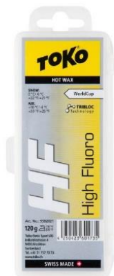
Abbildung 1 High Fluoro Gelb ( www.google.com , 2020)

Markt. Er kommt in den Einsatz, wenn es Alt- und Kunstsnee auf der Piste hat. Er schützt auch den Belag vor Schmutz und frischt den Belag wieder auf. 1998 kam die Carboon Grip Wax Linie auf den Markt. Dieser ist ausschliesslich für die klassische Technik. Man kann ihn ganz normal darauf sprühen. 1999 kam der Jat Strea New Snow+ Old Snow auf den Markt, der die gleiche Wirkung wie der Wet Jet hat, einfach ist der für alten und Neuschnee geeignet. 2002 kam der Helix Warm auf den Markt. Das ist noch einmal für die bessere Rennpräparation als der Jet Stream. Diesen sprayt man nach dem Auftragen des