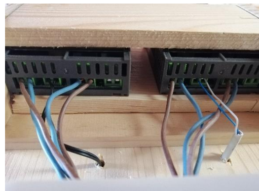
Abbildung 26 Thermostat mit Kabelverbindung (Jan,2020)

Als wir alles in die Dose verlegt hatten, verbanden wir die Kabel mit den zwei Thermostaten, damit wir sie einstellen konnten.