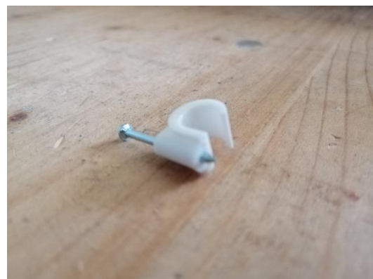
Abbildung 29 Kabelbriden (Jan,2020)

Am Schluss, dass alle Kabel schön geordnet sind, brachten wir noch Nagelbriden an.