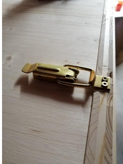
Abbildung 22 Verschluss (Jan,2020)

Als Verschluss der Tür verwendeten wir Kistenverschlüsse.