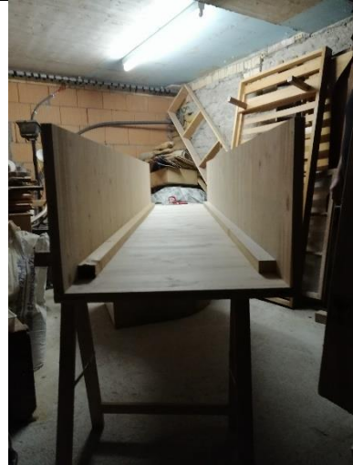
Abbildung 12 Seitenwand mit Boden und Deckel (Jan,2020)

Dann haben wir die zweite Leiste und dann den Deckel geschraubt und den an die Seitenwand geschraubt.